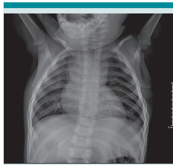
Figura 3. Paciente masculino de 1 año de edad, con estudio positivo a COVID-19 por TR PCR, con placa radiográfica de tórax en PA, con hallazgo menos típico consistente en aumento de la trama bronco vascular, por engrosamiento peribronquial.