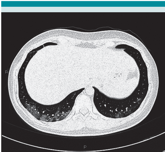
Figura 4. Paciente femenina de 16 años, con antecedente de carcinoma epidermoide no queratinizante. En la imagen de tomografía de tórax de alta resolución, en fase de inspiración, se observa el clásico patrón de aumento focal de la densidad, con patrón en vidrio deslustrado periférico, hacia los lóbulos inferiores.

En el estudio de tomografía computada es más frecuente encontrar un patrón en vidrio deslustrado de predominio periférico, zonas de consolidación, bilateral y con predominio hacia los lóbulos inferiores. 3,7,8 (Figura 4) El patrón periférico de las lesiones visto en la tomografía computada no se distingue fácilmente en la placa radiográfica. Cuando se comparan pacientes con neumonía por COVID-19 en relación