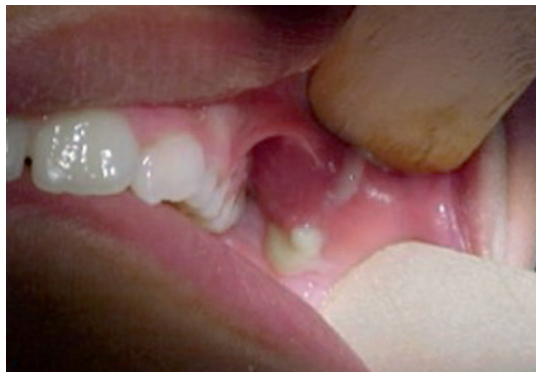
Figura 2. Salida de líquido purulento por el conducto de Stenon.

otalgia; malestar general, irritabilidad, anorexia, trismo, celulitis (edema, eritema y calor) de la piel circundante; por las carúnculas de la desembocadura del conducto puede salir espontáneamente saliva turbia o purulenta al realizar presión sobre la acumulación, por lo que el cuadro clínico recibe el nombre de sialoadenitis bacteriana aguda supurativa (Figura 2). 1,3,13,22 Usualmente, ocurren episodios inflamatorios repetitivos, separados por períodos asintomáticos y sin enfermedad sistémica acompañante, tres a cuatro veces por año, lo que hace al cuadro clínico un proceso crónico que da lugar a una sialoadenitis bacteriana crónica y recurrente. El aumento de volumen de la glándula se estabiliza con la consiguiente fibrosis del parénquima glandular que se manifiesta por una consistencia dura de carácter nodular de toda la glándula. 1,5,8 Cuando el cuadro es agudo se puede presentar de forma bilateral; en casos crónicos, casi siempre es unilateral.