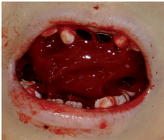
Figura 1. A la exploración intraoral se observa coágulo exofítico relacionado con sangrado en paladar duro del lado derecho.

Después de la exploración se comentó con el médico responsable que era necesario retirar un coágulo exofítico para determinar origen de la hemorragia, por lo que el Servicio de Hematología decidió trasfunder concentrado plaquetario. Al remover el coágulo exofítico (Figura 2) se encontró el origen del sangrado activo en encía insertada y paladar de incisivo lateral a segundo molar superior derecho, movilidad de incisivo lateral superior derecho y ausencia clínica de primer molar superior derecho, órganos denta-