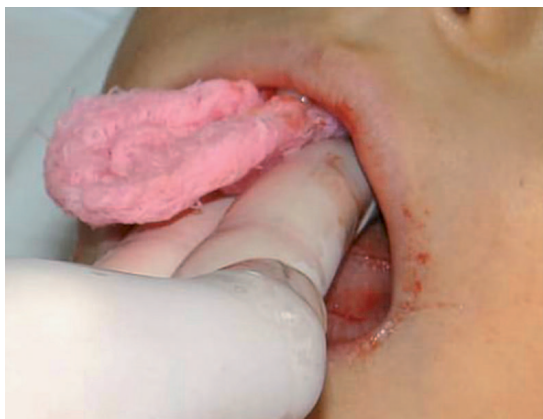
Figura 3. Hemostasia a base de presión y subsalicilato de bismuto después de la remoción de coágulo.