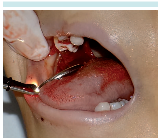
Figura 2. Persistencia de sangrado activo.

rios correspondientes a la fórmula temporal, por lo que se realizó hemostasia con medios físicos fríos y gasas impregnadas de subsalicilato de bismuto por 8 minutos (Figura 3), con lo que la hemorragia cedió (Figura 4).