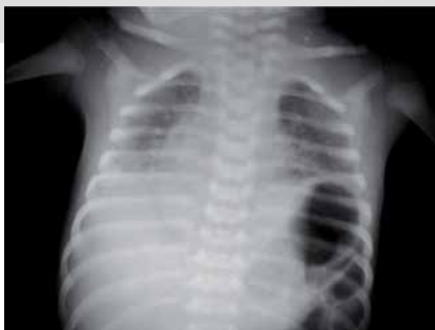
Figura 1. Radiografía de tórax postplicatura. Se observa elevación de ambos hemidiafragmas; las cúpulas se encuentran a nivel del quinto espacio intercostal.

A su ingreso, el paciente tenía datos de dificultad respiratoria: aleteo nasal, tiro intercostal, retracción supraesternal y xifoidea, polipnea. La oximetría de pulso al aire ambiente fue 74%. Requirió intubación endotraqueal y ventilación mecánica. En la tele de tórax, antes de iniciar la ventilación mecánica, se apreció elevación diafragmática izquierda que alcanzaba el cuarto espacio intercostal y elevación diafragmática derecha hasta el sexto espacio intercostal (Figura 1). En la fluoroscopia se observó elevación simétrica de ambos hemidiafragmas a nivel del tercer espacio intercostal, durante la apnea.