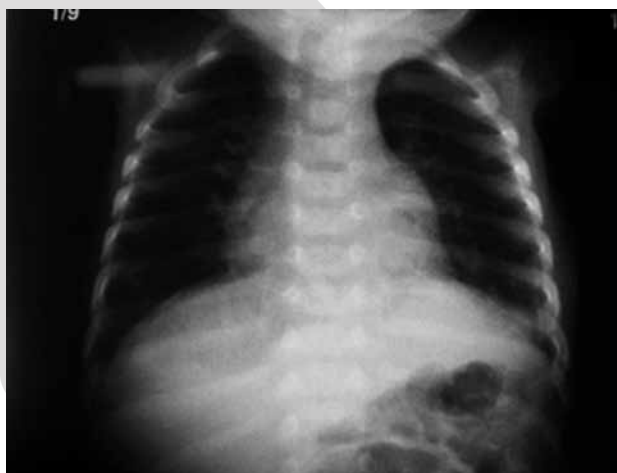
Figura 3. Radiografía de tórax simple a las 72 horas del postoperatorio.

tario; sus oximetrías de pulso eran normales. Se descartó la presencia de malformaciones asociadas. A tres años de su tratamiento quirúrgico, el paciente se encuentra asintomático.