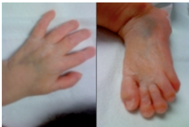
Figura 2. En manos y pies se aprecian primeros dedos anchos.