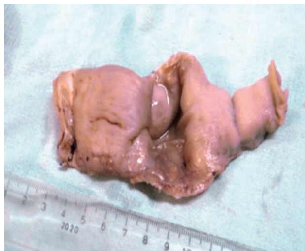
Figura 1. Aspecto macroscópico de uno de los tumores. Se observa formación polipode de la mucosa sin ulceración.

Caso 2. Niño de seis años quien inicio su padecimiento nueve días antes del internamiento, con dolor abdominal y vómito. Un facultativo le prescribió analgésicos; no hubo mejoría. Posteriormente, acudió al hospital de la zona, de donde fue trasladado a nuestra institución. A su ingreso se encontraron signos moderados de deshidratación. No tenía fiebre, ni dificultad respiratoria. En el abdomen se palpaba una tumoración en la fosa iliaca derecha de dimensiones no especificadas y peristalsis hiperactiva. La radiografía simple de abdomen mostró niveles hidroaéreos