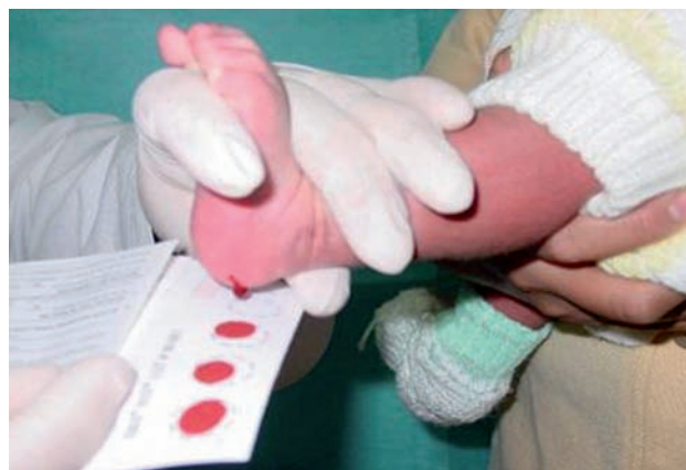
Figura 3. Posición sugerida de las manos del operador, para obtener un buen flujo sanguíneo.

8. Dejar secar la tarjeta de papel filtro y procurar no tocar con los dedos los círculos que contienen las gotas de sangre. Habitualmente las muestras se secan en dos o tres horas, dependiendo de la temperatura y humedad del ambiente.