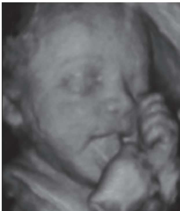
Figura 1. Un feto de 28 semanas esbozando una sonrisa.

El afectivo , es el más subjetivo de los tres, donde se observa que las emociones de la madre afectan el estado de ánimo del feto. Por ejemplo, cuando una madre se encuentra bajo estrés por dificultades con su pareja, puede haber rechazo y se afecta emocionalmente al bebé. Cuando la madre le habla constantemente al bebé dentro del vientre, se genera un vínculo afectivo dinámico. 2