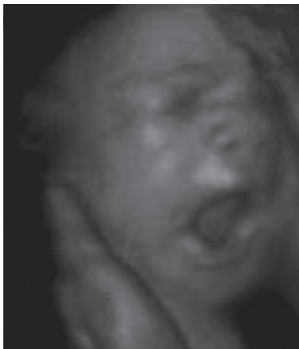
Figura 2. El bostezo es una actividad común en los seres humanos en desarrollo como se puede observar en este niño que se encuentra en el 3er trimestre de gestación 2 .