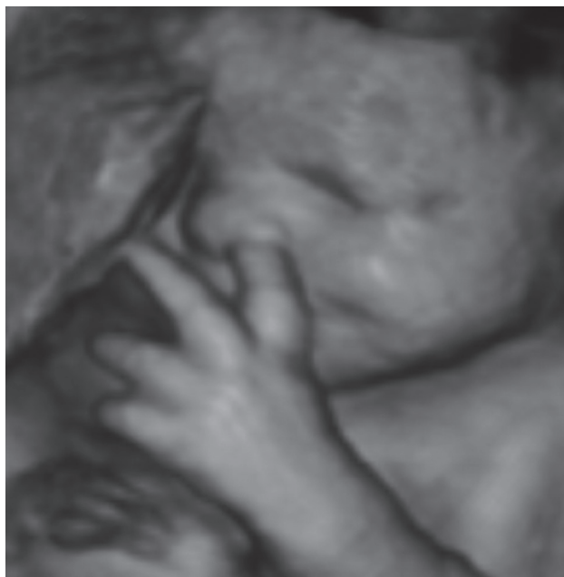
Figura 4. Algunos autores mencionan que es casualidad que se encuentren las estructuras como en este caso de hurgamiento nasal.

Después de 39 semanas de desarrollo de un ser, a partir del huevo a más de 70 billones de ellas, está formado y listo para la vida. Al nacer las funciones más importan-