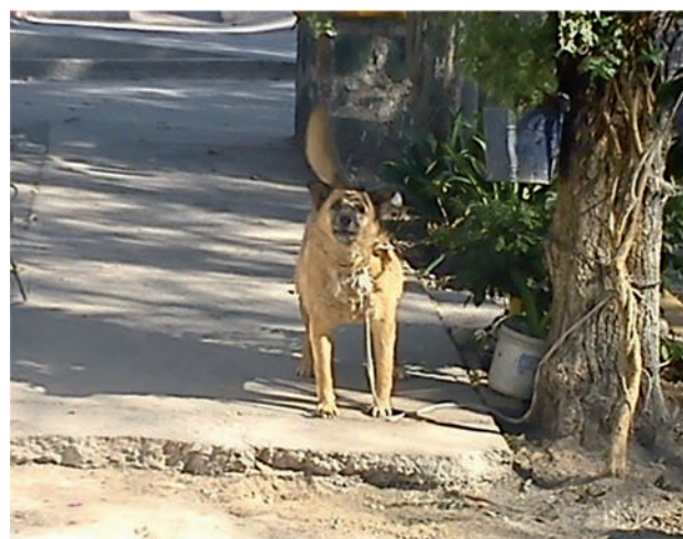
Figura 3. El animal agresor, cruz de pastor alemán, cuyo peso debió superar 30 kilos. Su aspecto es el de un perro agresivo.

satisfactoria. A los cinco días de operado se dio de alta. Se encuentra totalmente recuperado.