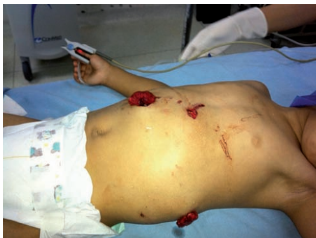
Figura 1. Imagen de las heridas causadas por la mordedura del perro.

El animal agresor era de raza indefinida, pesaba más de 30 kilos, tenía cinco años de edad y estaba vacunado contra la rabia (Figura 3). Había matado previamente a un perro más pequeño y atacado a un adulto. Era cuidado y alimentado por un vecino. La evolución del paciente fue