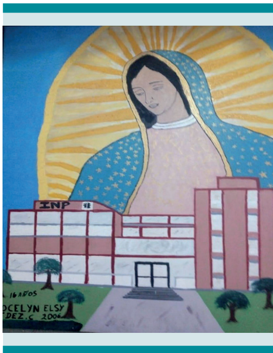
Figura 3. Mural Virgen de Guadalupe. Cuarto de máquinas.