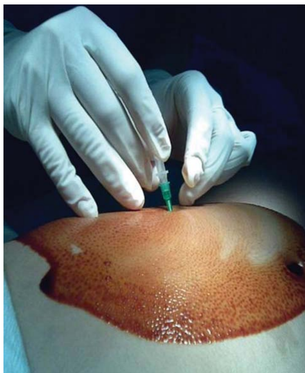
Figura 2. Punción intraperitoneal evacuadora con punzocath No. 17.

2), que permitió evacuar el aire intraperitoneal y estabilizar hemodinámicamente a la paciente. Durante la cirugía se halló una perforación en la cara anterior de la curvatura mayor del estómago, (Figura 3), causada por un vólvulo mesenterioaxial que se clasificó como vólvulo gástrico idiopático; había escaso líquido libre en “pozos de café”.