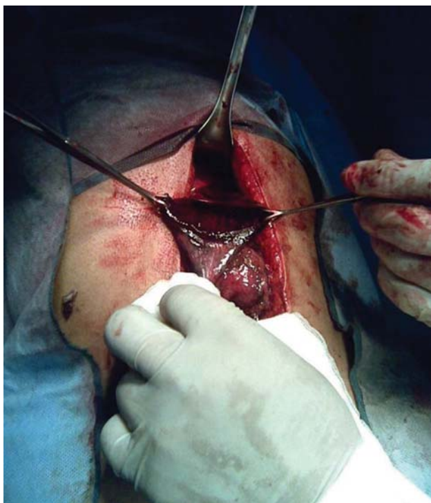
Figura 3. Obsérvese la magnitud de la perforación gástrica.

Se realizó cierre primario del estómago (Figura 4) y enseguida, una gastrostomía. No se encontraron defectos asociados. En el postoperatorio la paciente recibió doble esquema antimicrobiano por cinco días, apoyo ventilatorio y aminas por 12 horas.