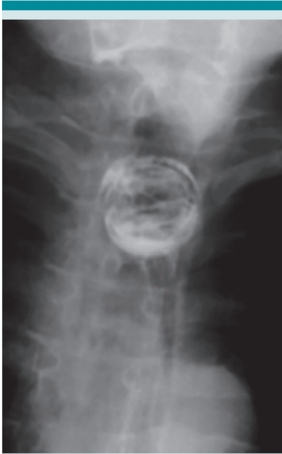
Figura 1. Canica en el tercio proximal del esófago.