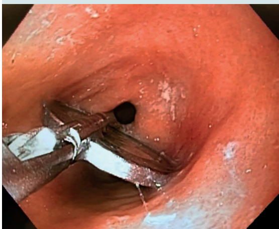
Figura 2. Moneda en la cámara gástrica.