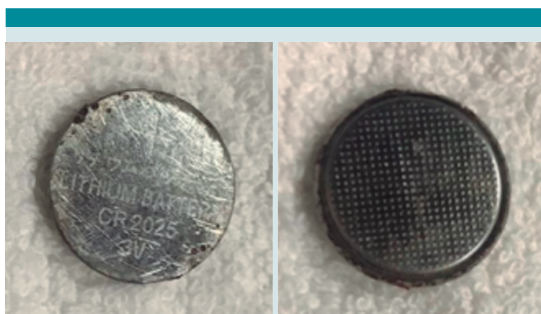
Figura 3. Bateria de botón de Litio Cr 2025 3V a la altura del tercio medio esofágico de 2 x 1.6 mm. A) Cara posterior de la batería, B) Cara frontal de la batería.

A los siete días, sin datos de fuga anastomótica, se retiró el drenaje y completó el esquema con antibiótico. En una nueva serie esofagogastro-duodenal con contraste hidrosoluble se valoró la permeabilidad esofágica, la ausencia de la estenosis y de fuga ( Figura 4 ). Posteriormente se reinició la alimentación por vía enteral, con dieta blanda. La paciente fue dada de alta del hospital, sin complicaciones. Puesto que no tuvo síntomas respiratorios, ni disfagia en el postquirúrgico, no se practicó la broncoscopia diagnóstica, que puede ser importante para la búsqueda de complicaciones esperadas: fístula traqueoesofágica o lesión nerviosa que pueden pasar inadvertidas en un estudio con contraste.