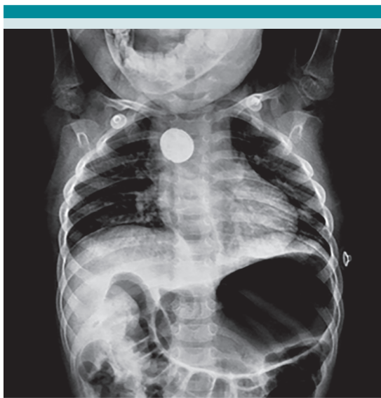
Figura 1. Radiografía de tórax anteroposterior en decúbito que evidencia un objeto radiopaco circular que se correlaciona con batería de botón a nivel torácico en el segundo estrechamiento fisiológico del esófago.

En el estudio con contraste hidrosoluble se evidenció el objeto, la estenosis de la luz esofágica de aproximadamente 90% en torno del cuerpo extraño ( Figura 2 ). Se indicó una tomografía