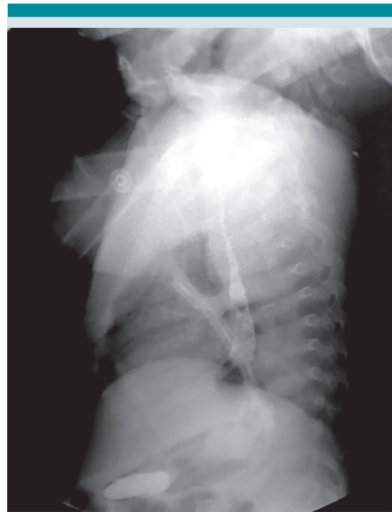
Figura 4. Estudio posquirúrgico con contraste hidrosoluble (esofagograma) que evidencia la permeabilidad de la luz esofágica.