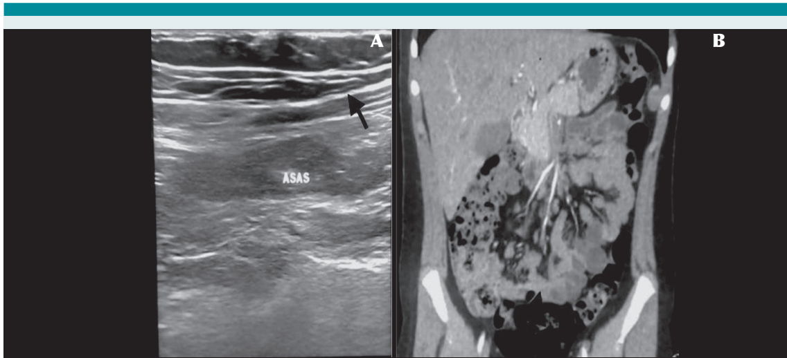
Figura 2. Exámenes de imagen: A) Ultrasonido de engrosamiento de pared intestinal (flecha), B) Tomografía coronal con engrosamiento de asas intestinales predominio ileal (flecha).

se ha observado que son pocos los pacientes con alteraciones extraintestinales, como piel, sistema urinario y gastrointestinal, información que se corrobora con esta revisión clínica. 5,6 La afectación gastrointestinal suele manifestarse con síntomas de enfermedad inflamatoria intestinal corroborada por exámenes de imagen y endoscopia. Actualmente, gracias al avance de técnicas sofisticadas en genética y biología molecular, se ha determinado el papel de los JAK (Familia de receptores Jannus Kinasa) en la patogénesis de la artritis reumatoide, artritis psoriásica, enfermedad inflamatoria intestinal, así como otras enfermedades inflamatorias. 7 Una acción inhibitoria a este nivel evitaría los trastornos inflamatorios que son múltiples en las diferentes enfermedades inmunológicas refractarias a agentes biológicos. 7,8