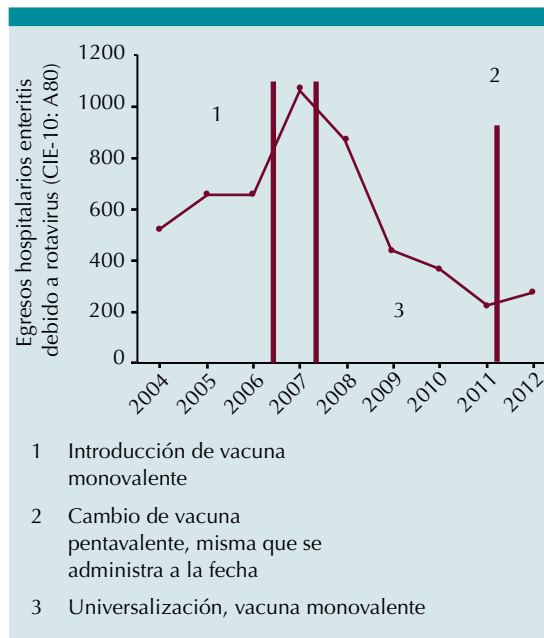
Figura 2. Egresos hospitalarios por enteritis debida a rotavirus (CIE-10: A080) en niños menores de 1 año (2004-2012).

Los casos totales de invaginación intestinal versus los esperados en niños menores de 1 año en México se reportan en la Figura 3 . Esta figura muestra un aumento en la cantidad de casos