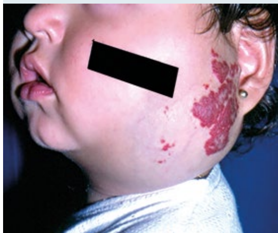
Figura 2. Hemangioma mixto: componentes superficial y profundo.