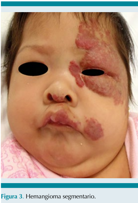
Figura 3. Hemangioma segmentario.

10% al año, por lo que a los 5 años habrá involucionado el 50% aproximadamente.