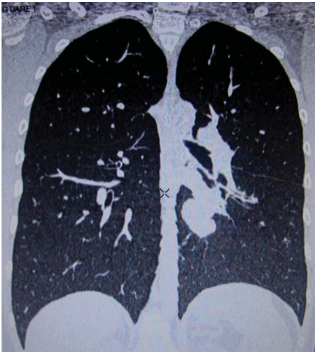
Figura 1. TAC con múltiples metástasis bilaterales.

ciclos de tratamiento adyuvante con bleomicina (VP16) y ciclofosfamida (CFM); estuvo vigilado durante un año. El seguimiento se llevó a cabo con TAC pulmonar cada tres meses; no se detectaron metástasis pulmonares durante 11 meses. En una TAC de control con técnica de "lung care" se apreciaron varias lesiones bilaterales. La de mayor volumen localizada en el pulmón izquierdo, medía 4 x 5 cm de diámetro en los segmentos 9 y 10, en contacto con el bronquio secundario (Figura 1). Las pruebas de función respiratoria, biometría hemática y tiempo de coagulación fueron normales. Se realizó toracotomía posterolateral izquierda con preservación muscular. Se resecaron en cuña dos lesiones pequeñas (Figura 2); una lesión de mayor tamaño requirió resección extraanatómica (resección que no sigue las delimitaciones anatómicas de los lóbulos pulmonares) del segmento superior del lóbulo inferior, con márgenes libres de enfermedad macroscópicamente, es decir, a simple vista. Durante la disección se identificó un trombo tumoral dentro de la vena pulmonar inferior izquierda. Se realizó pericardiotomía para control vascular. Una venotomía permitió identificar el trombo tumoral que estaba firmemente adosado al endotelio vascular. Se realizó una auriculotomía para extraer el trombo y reparación vascular. En el transoperatorio se produjo un