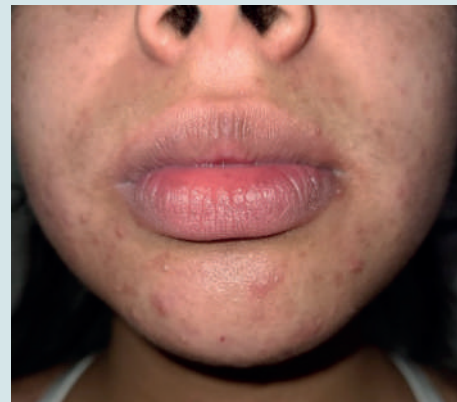
Figura 4. Empeoramiento de acné juvenil por el uso de cubrebocas.