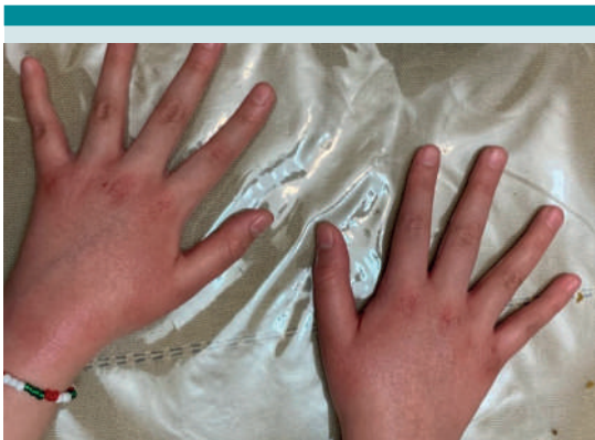
Figura 1. Adolescente con dermatitis por contacto al gel antibacterial. Nótese eritema, descamación y resequead en ambas manos.

Durante la pandemia de Covid-19 en nuestra consulta de Dermatología en el Instituto Nacional de Pediatría hemos observado los siguientes casos clínicos: dermatitis de contacto irritativa por uso de geles antibacteriales y uso de cubrebocas, dermatitis atópica exacerbada, empeoramiento del acné juvenil, rosácea, dermatitis seborreica y dermatitis perioral. Figuras 1 a 8