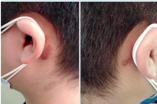
Figura 7. Niño de 10 años con dermatitis atópica y dermatosis retroauricular ocasionada por las cintas del cubrebocas, obsérvese placas de eritema, exulceraciones y eccema. Con dolor y prurito.

La piel funciona como un órgano de defensa primaria contra el medio ambiente, además es un órgano sensorial, excretor y regulador crítico de la temperatura corporal, sus propiedades de defensa son amplias y permiten la protección contra las radiaciones ultravioleta, oxidantes y agentes tóxicos.