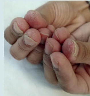
Figura 3. Adolescente con descamación, fisuras y dolor en pulpejos de los dedos, de ambas manos, por el uso constante de jabón y antibacterial.