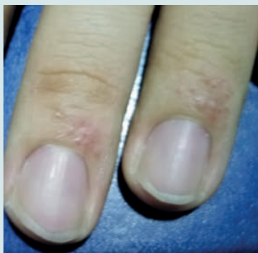
Figura 2. Adolescente con dermatitis por contacto al uso de jabón. Vesículas que confluyen, resequead y eritema en dedo medio y anular.