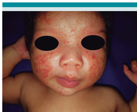
Figura 1. Acné neonatal. Masculino de 3 semanas de vida, con dermatosis facial de predominio en mejillas y frente de 1 semana de evolución, constituidas por pápulas eritematosas, pústulas y comedones cerrados.

Durante el período neonatal pueden presentarse erupciones acneiformes como: medicación materna de hidantoína y litio, enfermedades infecciosas como foliculitis bacteriana y causas