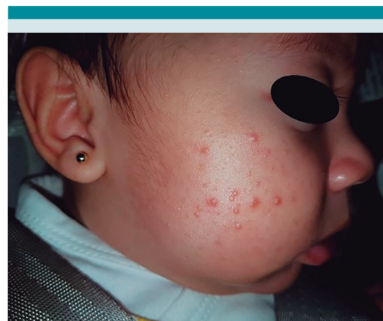
Figura 2. Acné infantil. Femenina de 4 meses de edad con lesiones en mejillas de 2 meses de evolución, constituidas por pápulas, pústulas inflamatorias, comedones abiertos y cerrados.

La mayor parte de los casos de acné infantil no están asociados a endocrinopatías subyacentes;