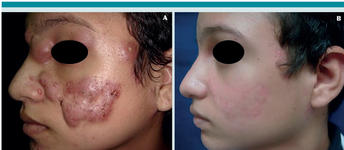
Figura 9. Acné conglobata. A) paciente de 13 años de edad con lesiones nodulares y quísticas bilaterales de 1 mes de evolución. B) A los 6 meses de tratamiento con isotretinoína oral.

El conocimiento del acné pediátrico permitirá al médico tratante o al pediatra sospechar o no una enfermedad subyacente. La influencia de la