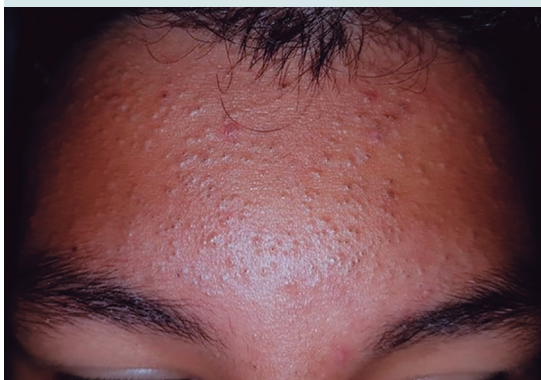
Figura 6. Acné preadolescente. Masculino de 11 años, con comedones cerrados y abiertos en la frente de 3 meses de evolución. No hay historia previa de uso de medicamentos.