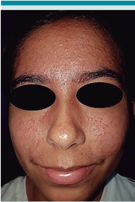
Figura 8. Reacción acneiforme por corticosteroides tópicos. Femenina de 15 años de edad, con numerosas lesiones papulares monomorfas, secundarias al uso de betametasona crema, dos veces al día durante 2 meses.