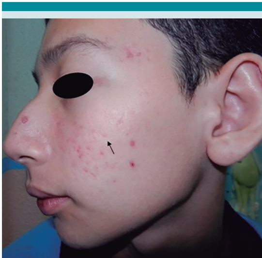
Figura 3. Antecedente de Acné infantil. Varón de 14 años, historia de padre con acné severo. A los 10 años de edad recaída, acné persistente. Se observan lesiones y cicatrices atróficas (flecha).

sin embargo, ante casos severos, persistentes, que no responden al tratamiento y con signos clínicos de hiperandrogenismo (vello púbico, hirsutismo, alopecia, crecimiento acelerado, olor corporal, desarrollo genital, etc.), 63 es necesario descartar algún trastorno endocrinológico mediante exámenes de laboratorio. 52,64 Cuadro 2