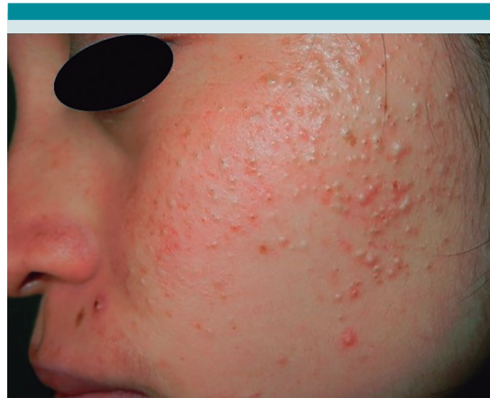
Figura 7. Acné persistente. Femenina, a los 11 años inició acné, manejada con cursos de terapia tópica y antibióticos orales. A sus 25 años, persisten lesiones inflamatorias y comedonales. No datos de hiperandrogenismo.

dio fue 9.97 años, la mitad no tenía signos de pubertad. La prevalencia de acné en estas niñas fue de 77.8%, siendo el de tipo comedónico 62%, el inflamatorio 2.9% y mixto 35.0%. La prevalencia de acné severo en la adolescencia está relacionado al inicio temprano de la menarquia y mayores niveles séricos de DHEAS y testosterona total y libre comparados con niñas con acné leve. 10