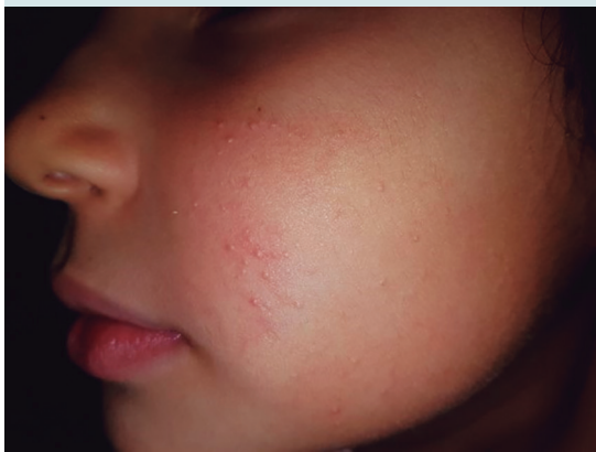
Figura 5. Queratosis pilaris. Niña de 6 años de edad con pápulas foliculares en mejillas desde la edad de un año, asintomáticas.

El desarrollo de acné en niñas premenárquicas ha sido reportado en 61.0-71.3%. 70 En un estudio de 623 niñas premenárquicas cuya edad prome-