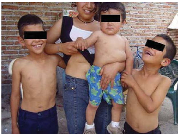
Figura 2. Cuatros miembros más de la familia operados por la misma enfermedad.

A fin de estudiar a la familia en forma completa hicimos una visita domiciliaria y entre los datos obtenidos destacaron los siguientes: La casa habitación de todos